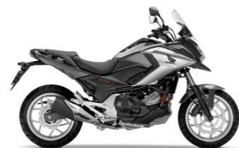
Sword Silver Metallic