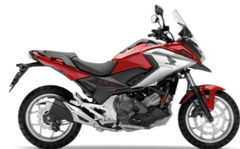
Candy Arcadian Red