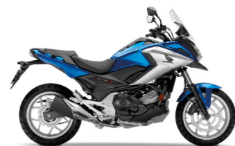
Glint Wave Blue Metallic