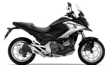
Matt Gunpowder Black Metallic